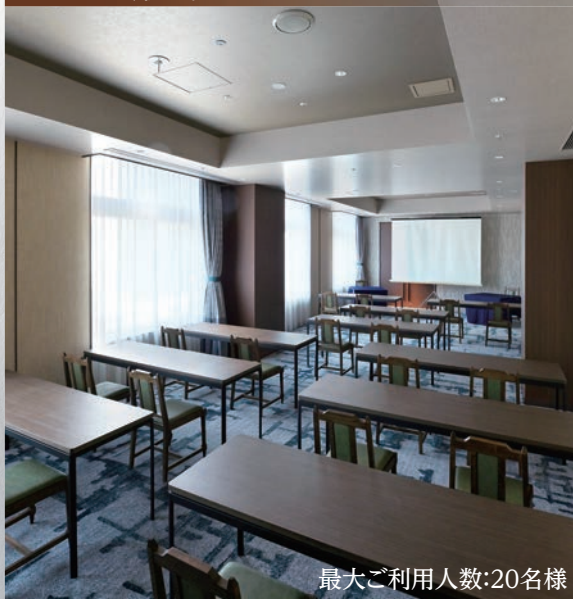
最大ご利用人数:20名様