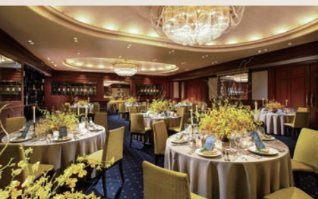
専用ラウンジを有したアットホームな ウェディングシーンを演出「アメジスト」