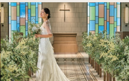
「自然」をテーマにした新チャペルが誕生!