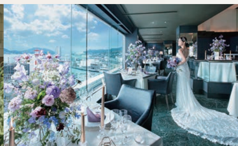
最上階の絶景に包まれた自由なスタイルもオススメ