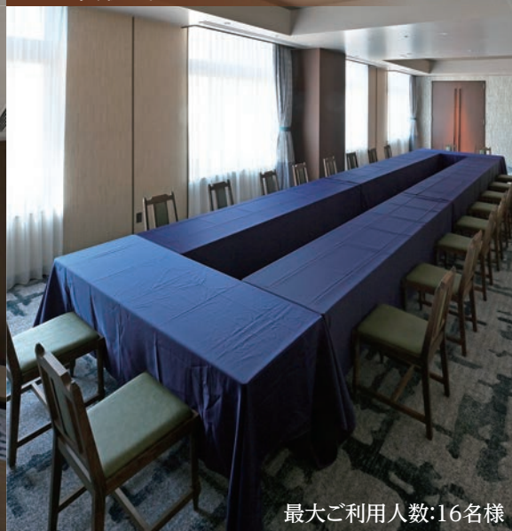
最大ご利用人数:16名様