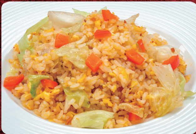
① レタスと松の実入りXO醬炒飯