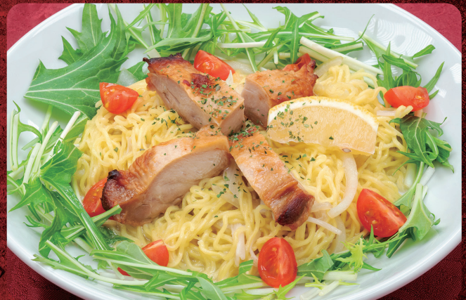
② 国産鶏のガーリック塩レモンまぜそば