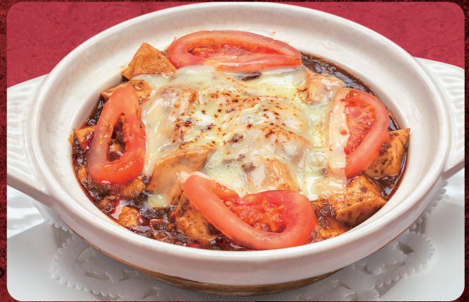
② 焼きチーズトマト麻婆豆腐ご飯