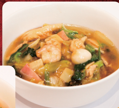
⑤ 野菜たっぷり 五目湯麺