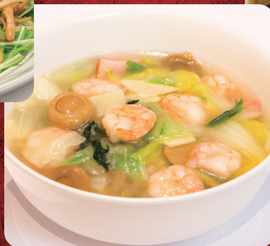
④ プリプリ海老と 烏賊の塩味湯麺