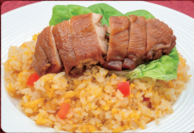
① 鶏肉のほろほろ煮 黄金炒飯